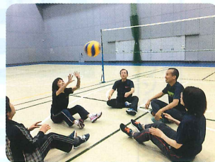
シッティングバレーボール